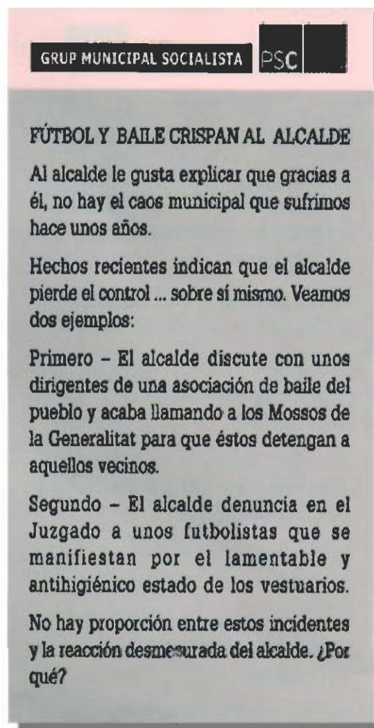
Retall escanejat del full repartit amb l'alba 22